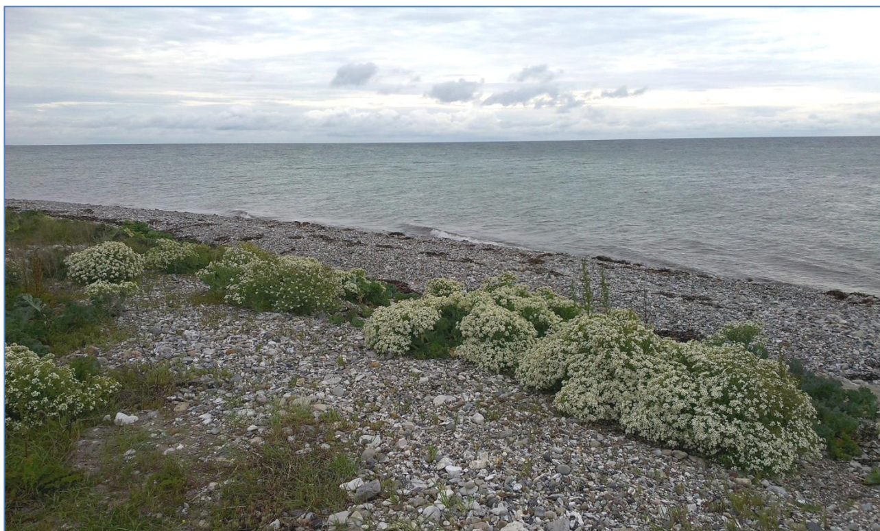
Strandvold med flerårig vegetation på Endelave